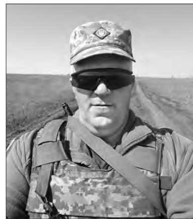
Герой України Василь Боєчко.

відомому за часів Другої світової війни Лютізькому плацдармі та в подальшому давати відсіч атакам ворога з боку Мошну, Бучі та Ірпеня. І українські воїни буквально вгризлися в цю мерзлу землю, у цей плацдарм і тримали його до останнього.