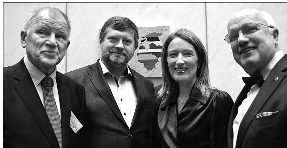
Перший заступник Голови Верховної Ради України Олександр Корнієнко зустрівся з Головою Європейського Парламенту Робертою Мецолою.

«Пані Мецола говорила про агресію з боку росії стосовно Литви, Латвії та Естонії.