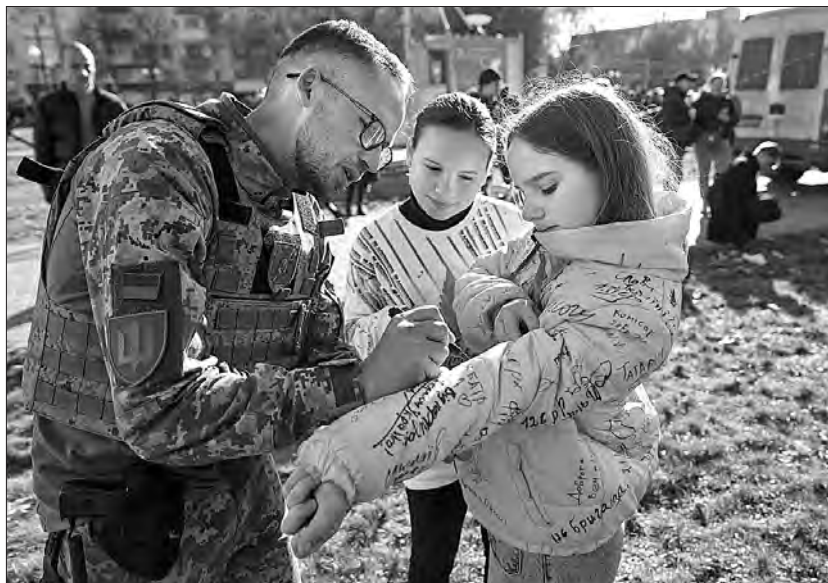
Під час війни наші діти мріють взяти автограф не в голлівудських зірок, а у воїнів ЗСУ.

«В умовах війни цілеспрямоване систематичне формування почуття патріотизму, духовної і психологічної готовності до виконання громадянського та конституційного обов'язку щодо захисту суверенітету, територіальної цілісності країни є провідним, — зазначають в Освітній агенції Києва. — Особливо актуальною є підготовка учнівської молоді до захисту життя та здоров'я, забезпечення власної безпеки і безпеки інших людей у